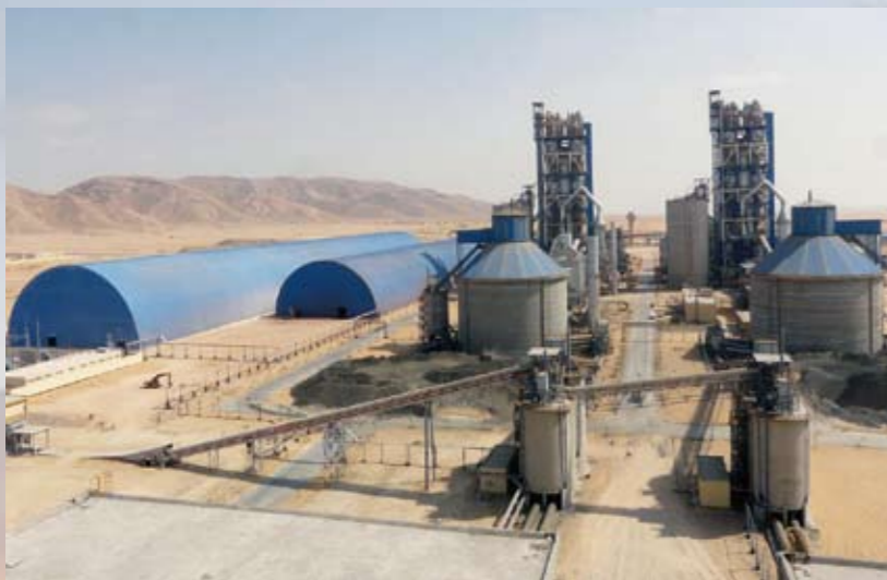
埃及GOE项目现场全景