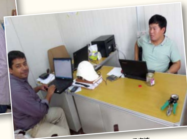
我公司伊拉克粉磨站项目部人员与业主人员交流