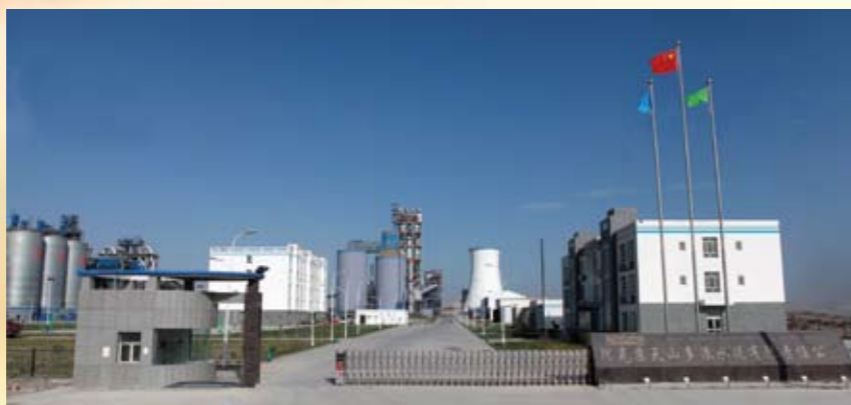
天山多浪项目现场全景