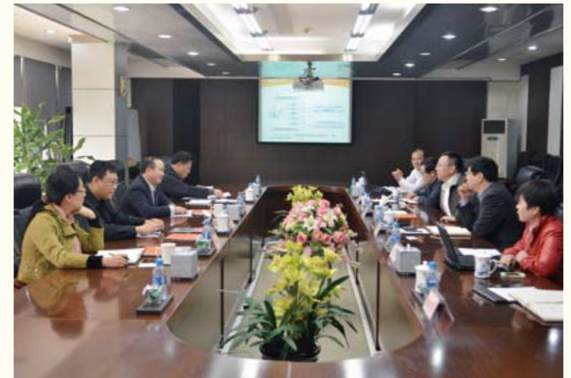
潘爱华到公司指导工作

2013年11月3日，工业和信息化部原材料工业司副司长潘爱华到中材集团在津装备工程企业调研。中材集团副总经理于国波、公司总经理徐培涛、装备集团副总经理隋明洁等热情接待了潘爱华一行。