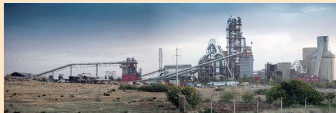
公司摩洛哥FES项目全景

摩洛哥FES项目属于EP+电气安装与调试项目，是我公司与Holcim摩洛哥集团的第二个合作项目，实现了Polysius初建项目的改造升级，为摩洛哥著名旅游城市——古城FES的环保减排做出了贡献。（摩洛哥FES项目部）