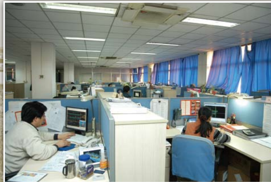
公司工程设计人员正在精心设计工程项目