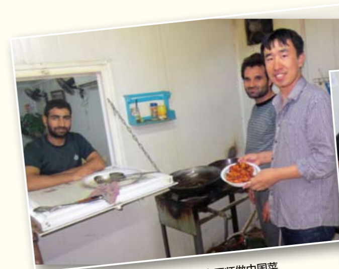
我公司伊拉克粉磨站项目部教业主方厨师做中国菜

尽管条件艰苦，但项目现场员工团结一心，努力让现场变成大家在一个国外的一个温暖的小家。现场负责人主动与业主方人员反复协调，努力给大家创造良好的生活环境和就餐环境，确保食品安全，同时尽可能地增加饭菜的花样，以满足现场同志的不同的饮食需求。因为业主方厨师不太熟悉中国人的饮食习惯，现场的同志就主动与厨师交流，利用休息时间将自己的厨艺倾囊相授，力争让每位现场的同志能尝到近似中国人口味的中餐。（吴治昆）