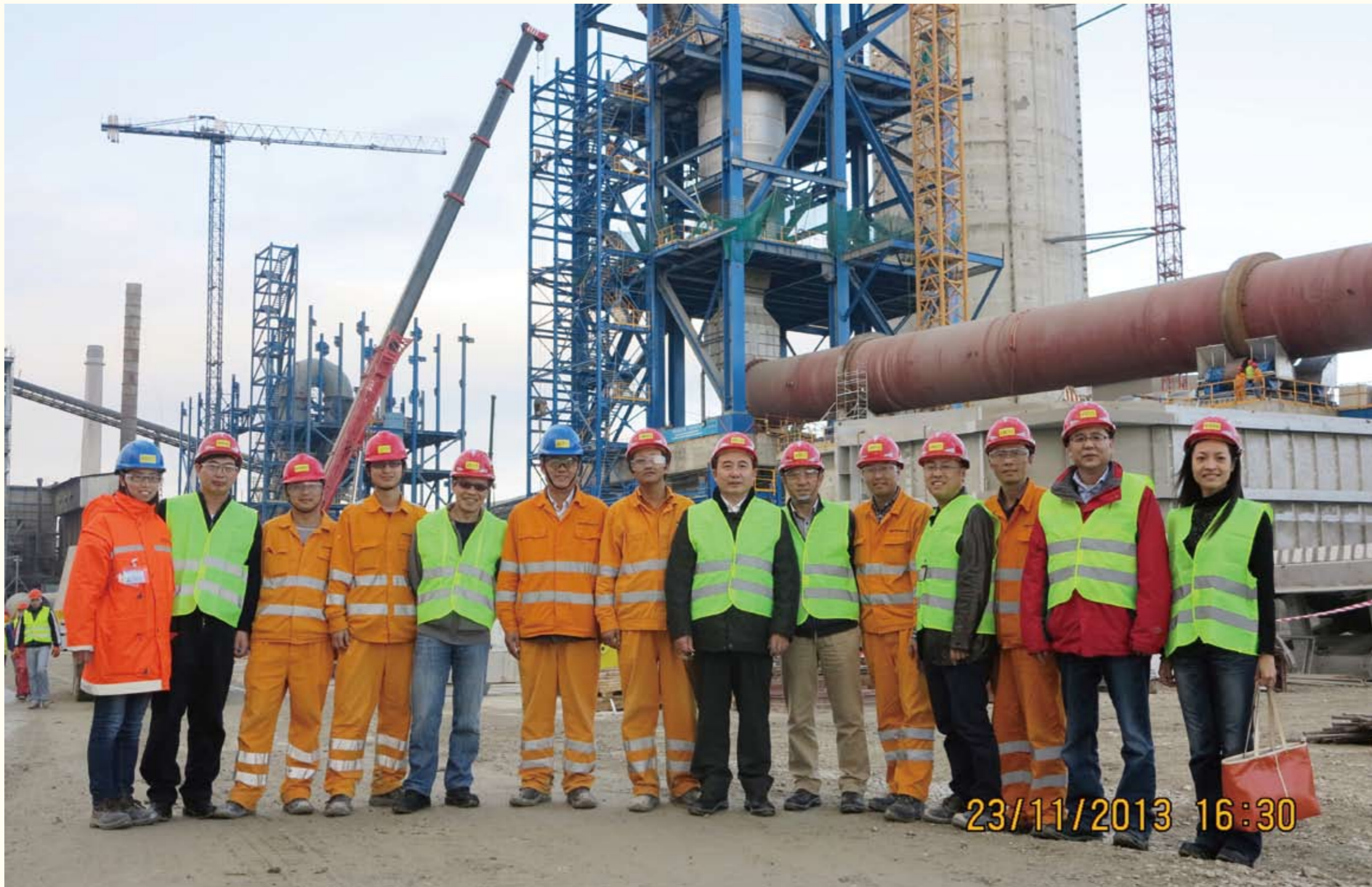
刘志江（左八）一行视察保加利亚Devnya项目现场时与项目管理人员合影

2013年11月23日，中材集团董事长刘志江一行到我公司承建的保加利亚Devnya项目视察指导工作。