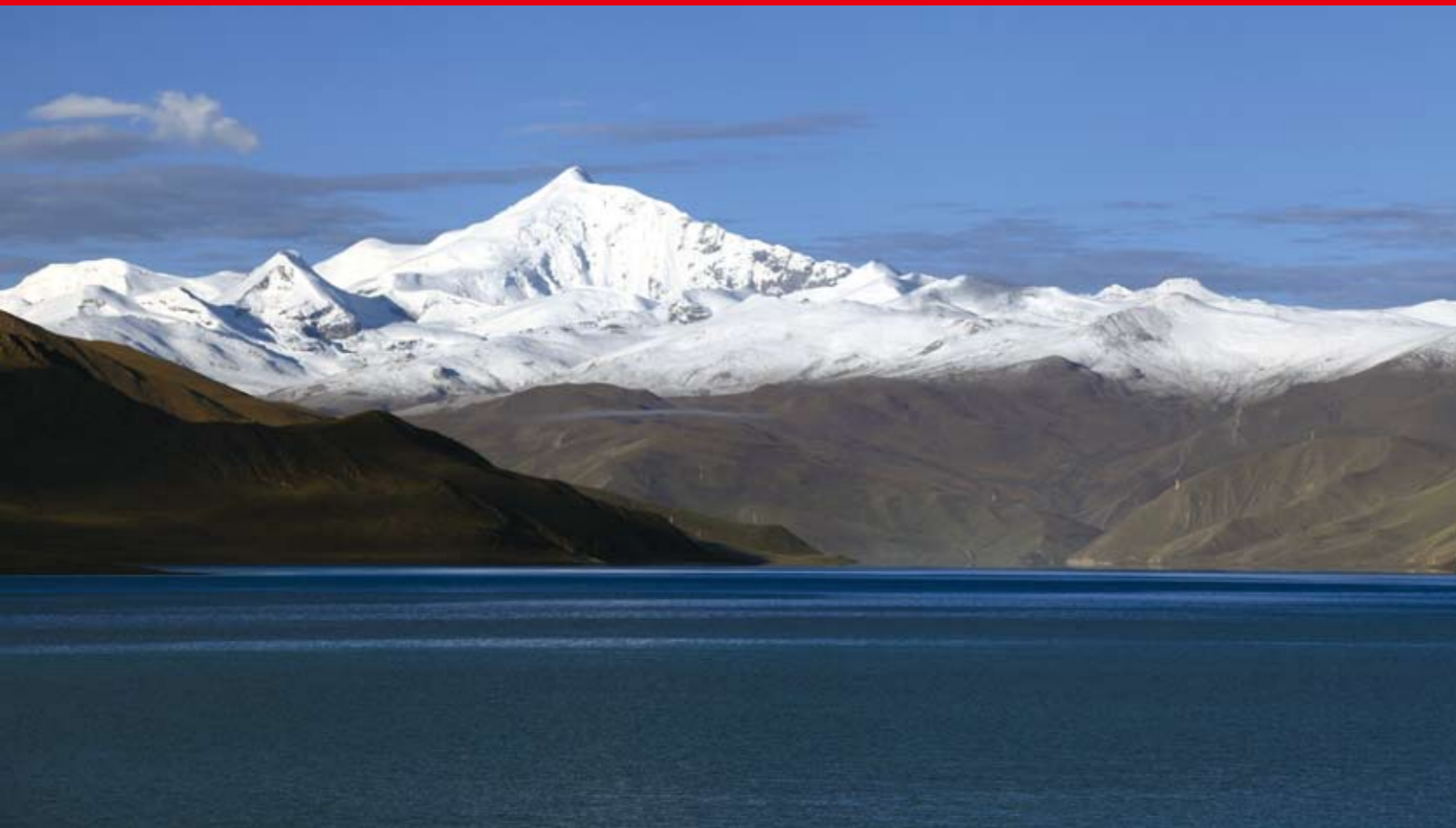
神山·圣湖（西藏羊卓雍措）/ 丁贤科