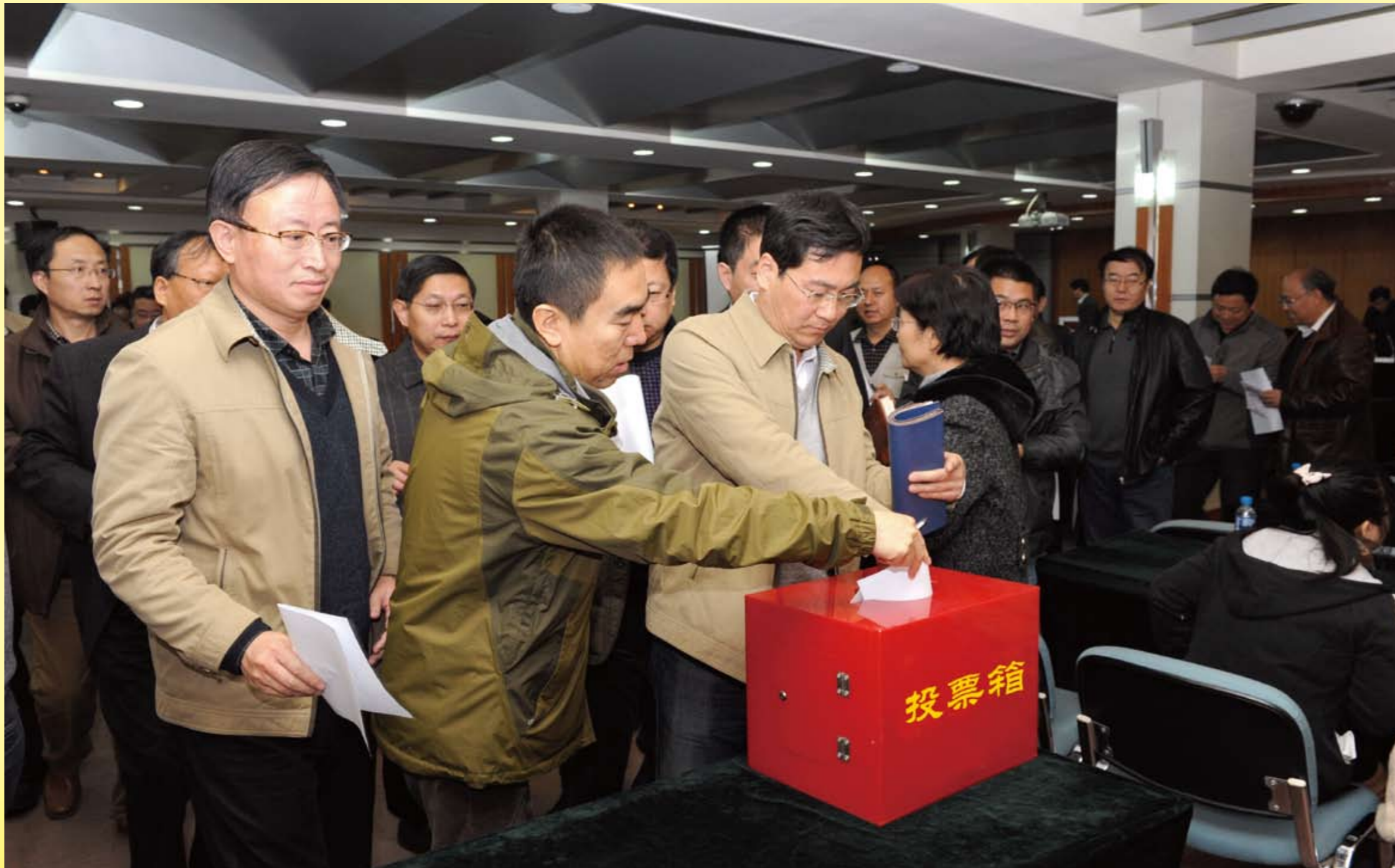
职工代表无记名投票评议领导班子专题民主生活会情况

2013年11月29日上午，公司召开党的群众路线教育实践活动领导班子专题民主生活会情况通报会。公司领导班子成员等，近70人参加了会议。中材集团第一督导组组长贾作起、组员龙跃到会指导。