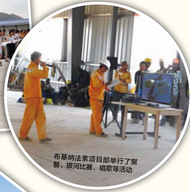
布基纳法索项目部举行了聚餐、拔河比赛、唱歌等活动