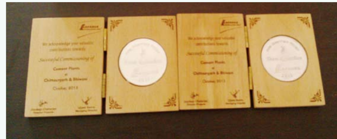
印度拉法基CHI项目业主授予的突出贡献奖章

印度CHI项目是我公司与拉法基集团在印度合作的第二个项目，也是我国公司在印度承建的首条完整生产线，对公司开拓印度市场具有重要的示范意义。项目自今年8月点火以来，已经平稳运行了近三个月，成功生产熟料近四十万吨，并在刚刚结束的“预考核”工作中，生产线各项指标均超过合同规定值，取得了业主的高度信任和认可。（ 谌佳荣 ）