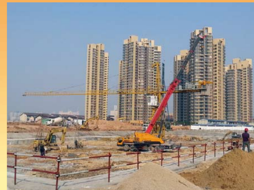
正在建设的珠海横琴开发区高级人才公寓项目

发挥公司在水泥工程领域积累的优势，纵向拓展，以点带面，充分挖掘客户资源和项目，签订了瑞能马尔代夫和巴布亚新几内亚工程钢结构制造、马来西亚槟城三星电厂土建施工、印尼加气混凝土生产线、珠海横琴开发区高级人才公寓等7个项目，合同金额达3.5亿元。陕西生态矿山、宿迁水处理等项目在有条不紊进展中。印尼合资公司以及俄罗斯工程公司和设计院的并购工作取得了阶段性成果。