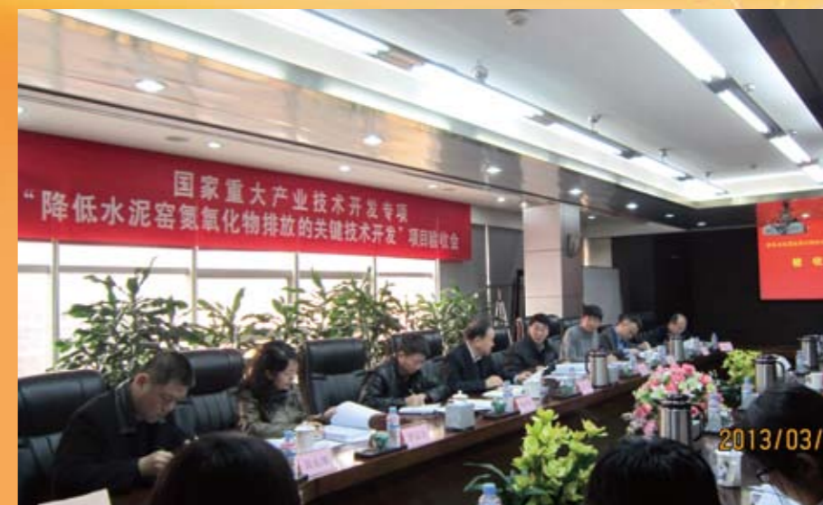
国家重大产业技术开发专项“水泥窑降低氮氧化物的技术研发及应用”通过项目验收

全年完成专利申请30项，其中发明专利12项，创单年申请发明专利之最。1项成果荣获行业科技进步一等奖、5项成果荣获行业科技进步二等奖。1项成果获得行业技术革新二等奖、4项成果获行业技术革新三等奖。2个项目通过天津市科技成果鉴定，鉴定结论分别达到国际领先和国际先进水平。