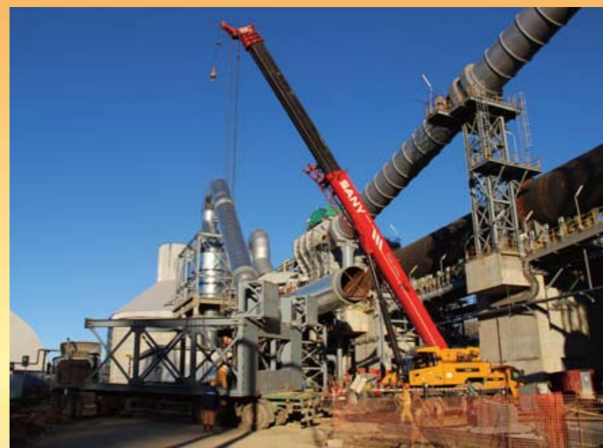
俄罗斯FER项目现场安装作业

项目履约能力和抗风险能力不断提升，执行效果越来越好。36个项目正在积极稳妥向前推进，6个项目取得PAC，7个项目获得FAC。15个脱硝项目已经投产。一批新项目正在紧张地筹备中。