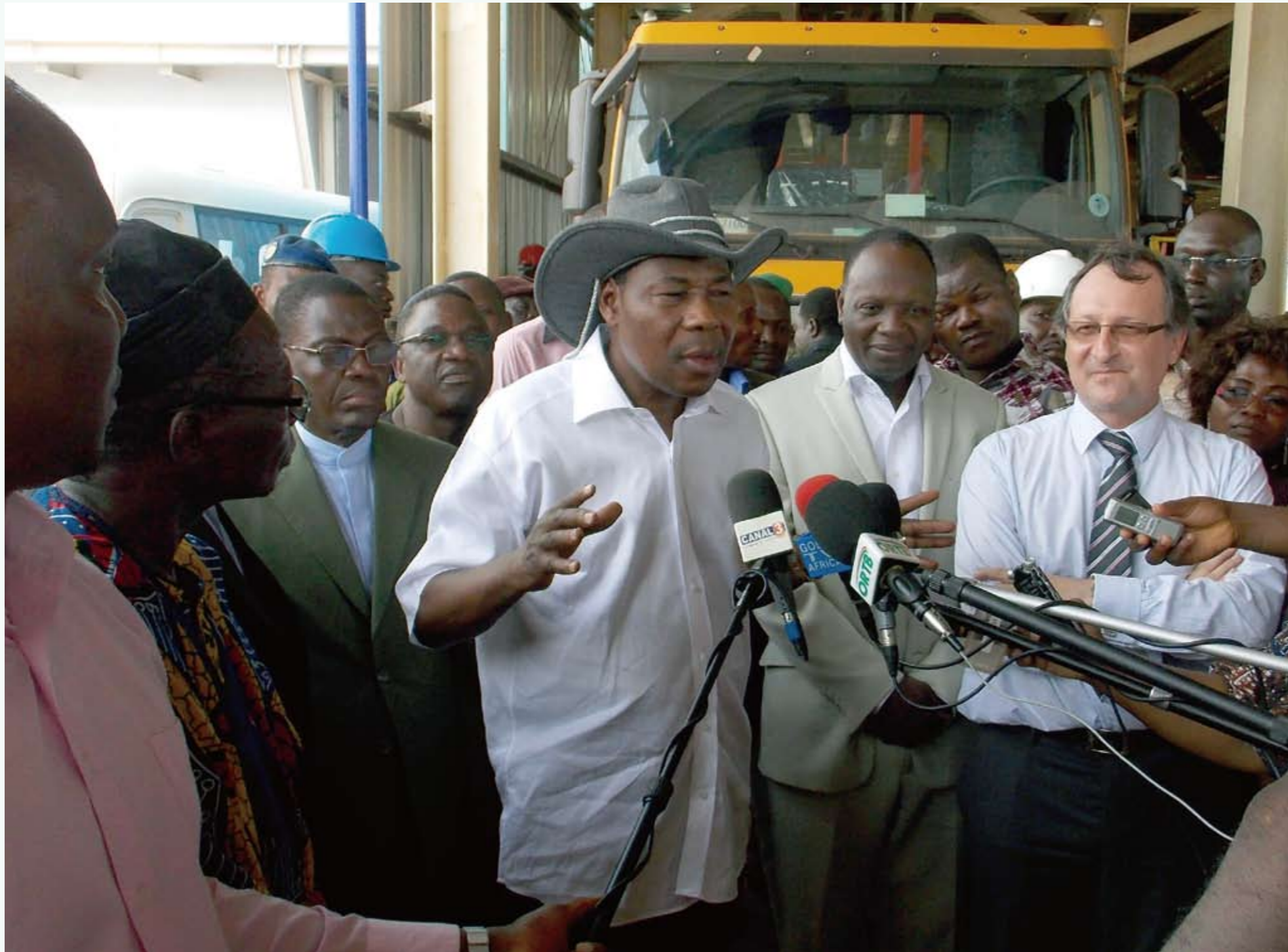
亚伊总统发表讲话