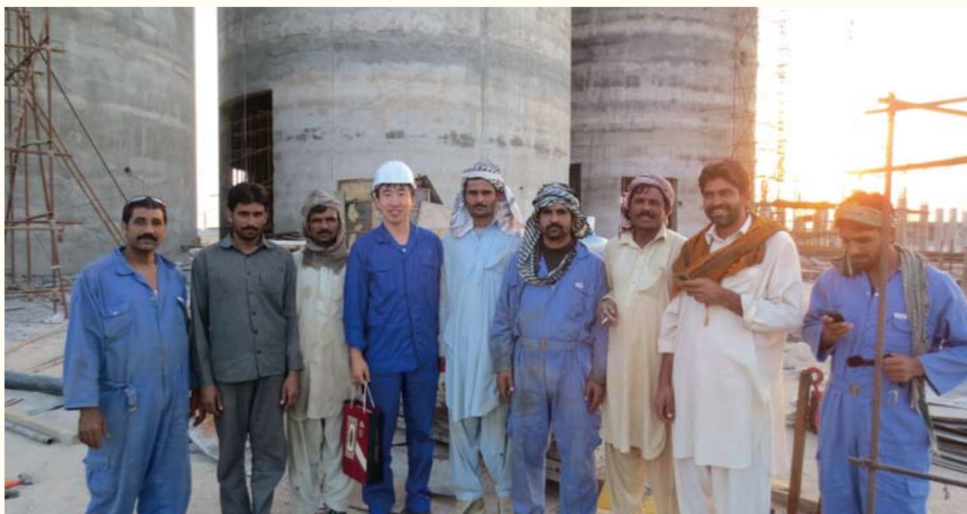
我公司伊拉克粉磨站项目部人员和业主方人员打成一片