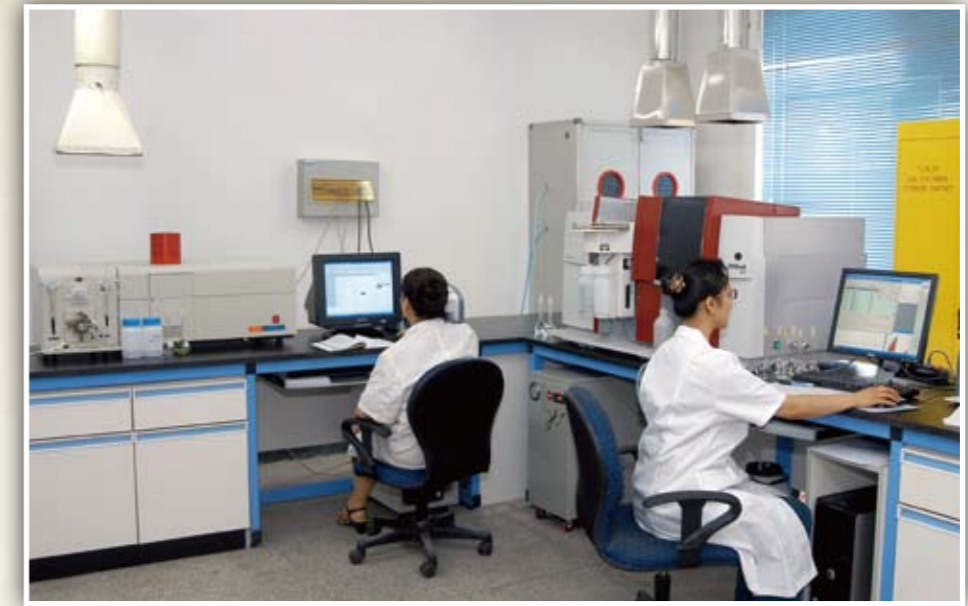
公司科研人员正在技术研发中心实验室工作

近年来，公司高度重视科技创新和管理创新，不断加强新技术的研发和应用力度，不断规范公司的管理流程，创新管理思路，并取得了显著成效。（彭爽）