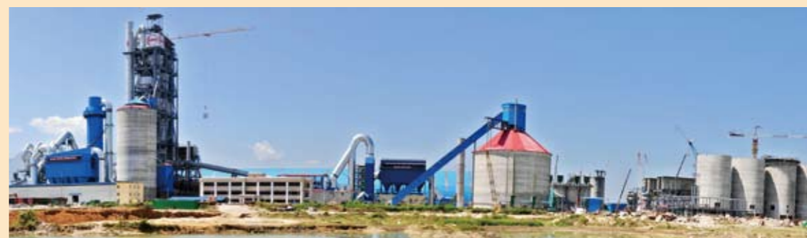
马来西亚HUME项目全景