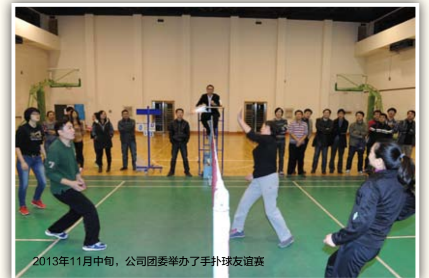
2013年11月中旬，公司团委举办了手扑球友谊赛