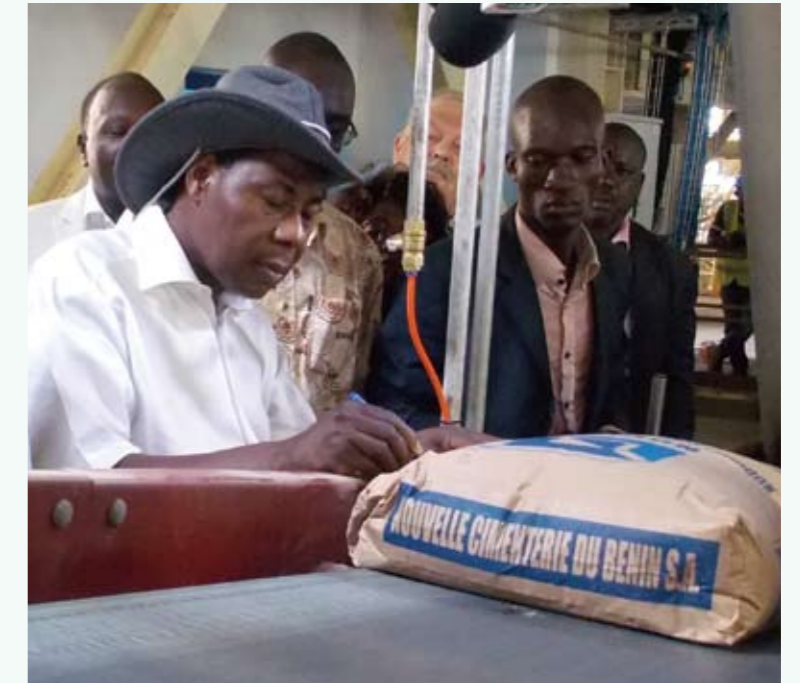
亚伊总统在水泥包装袋上签名祝贺NOCIBE水泥厂投产

2013年12月2日，贝宁总统博尼·亚伊第三次考察由我公司承建的NOCIBE水泥厂。