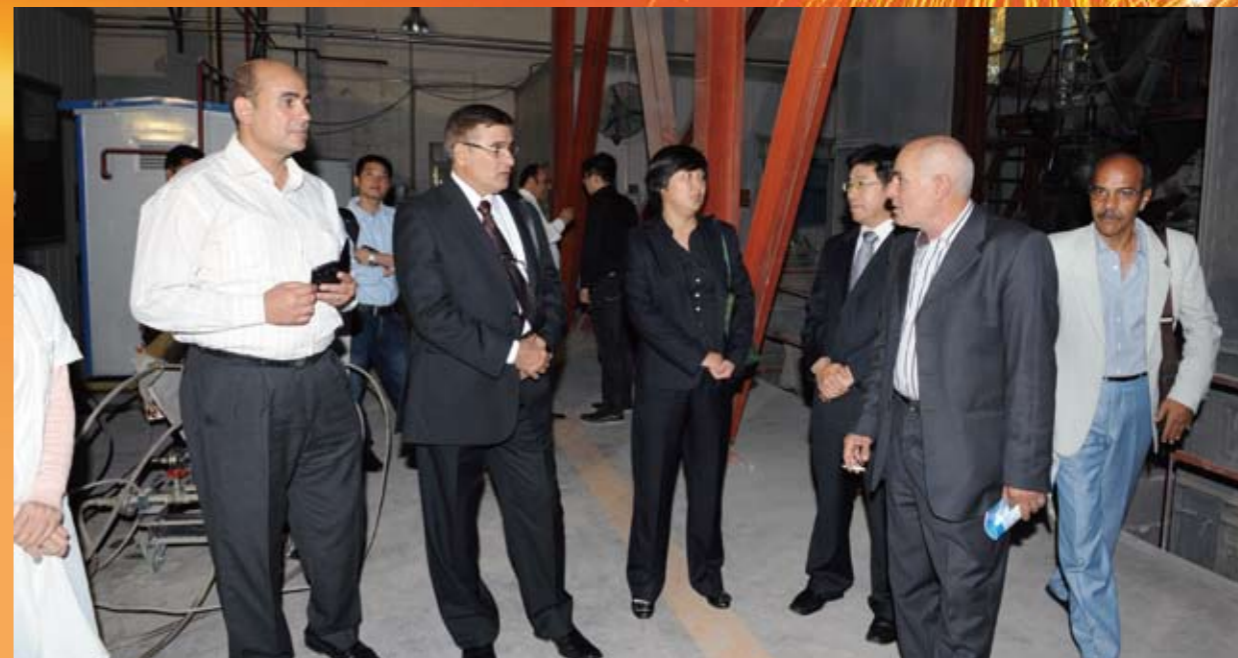
埃及GOE项目业主方埃及国防部将军KAMALELDIN（左二）参观我公司研发设施

编制了《生产总包项目管理实用手册》，建立项目管理台账，确保项目管理规范化、程序化、数据化，有效规避了项目运营风险。埃及GOE生产总包项目获得业主高度评价，并提出续签长达五年的第二轮生产总包合同。年实现营业收入1.65亿元，并保持了良好的经济效益。