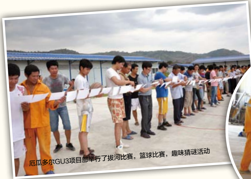
厄瓜多尔GU3项目部举行了拔河比赛，篮球比赛，趣味猜谜活动