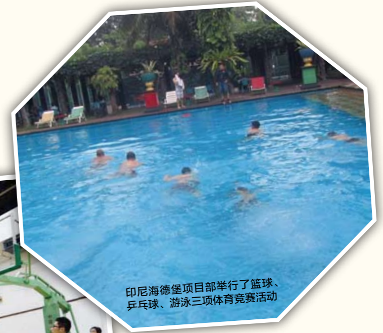
印尼海德堡项目部举行了篮球、乒乓球、游泳三项体育竞赛活动