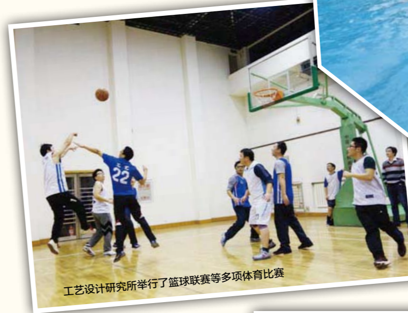
工艺设计研究所举行了篮球联赛等多项体育比赛