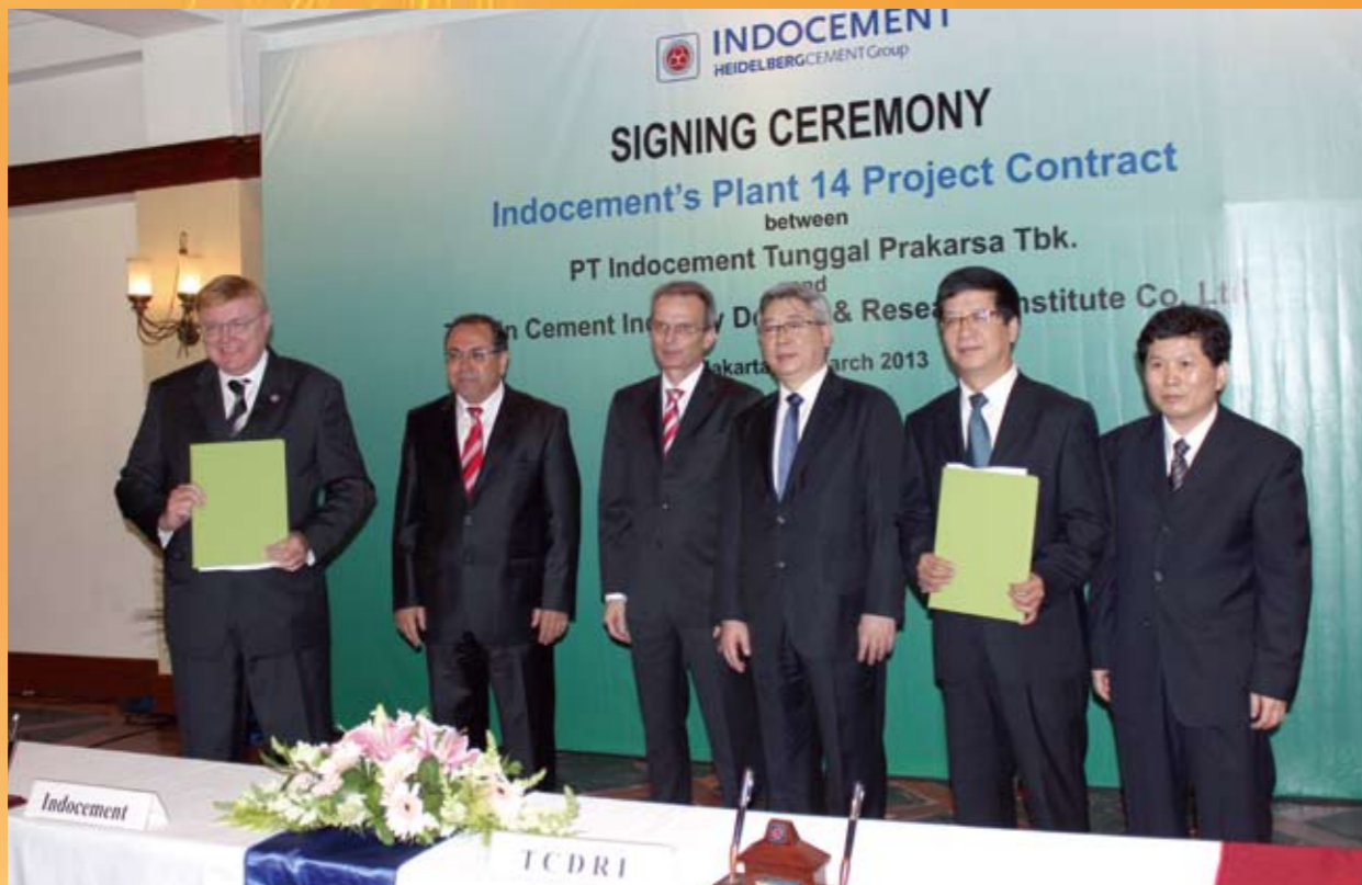
印尼海德堡万吨线水泥生产线项目合同签约仪式