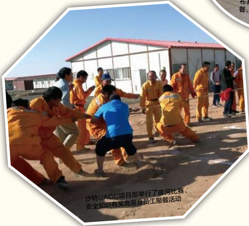
沙特UACC项目部举行了拔河比赛、安全知识有奖竞赛及员工聚餐活动