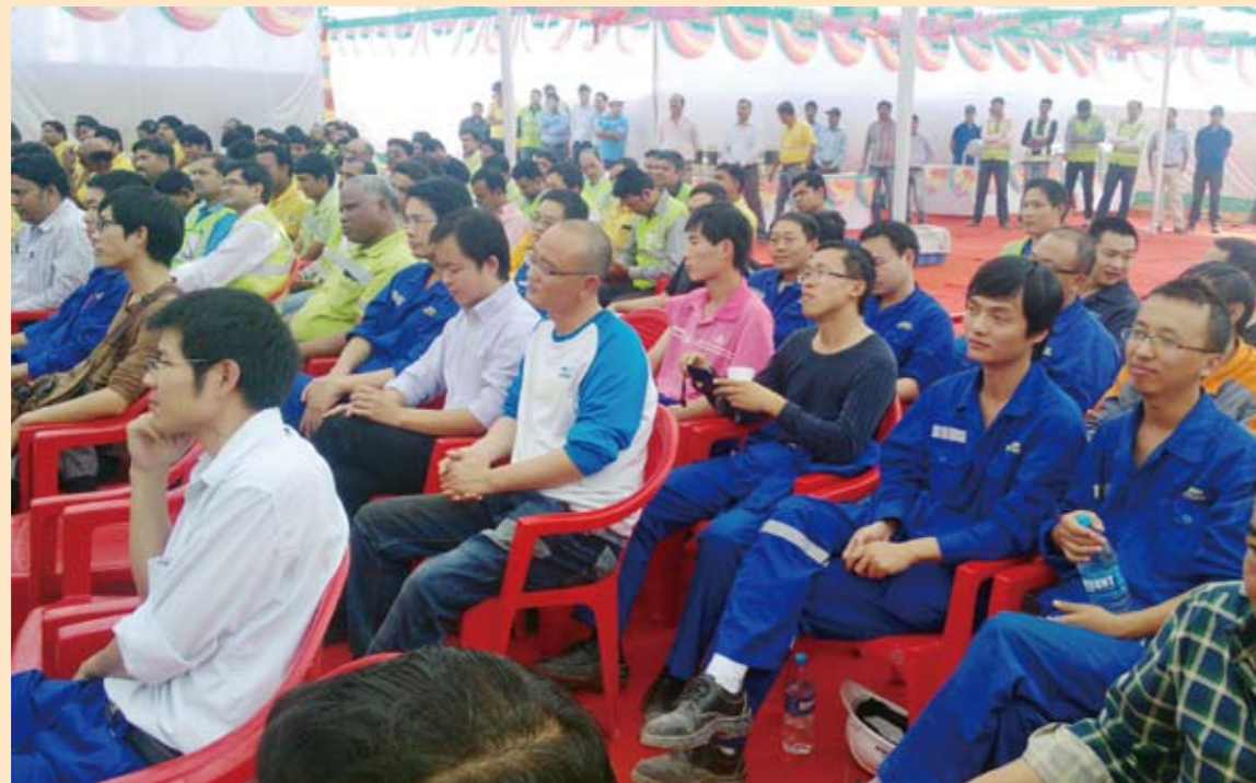
我公司印度拉法基CHI项目部全体人员应邀参加庆典活动